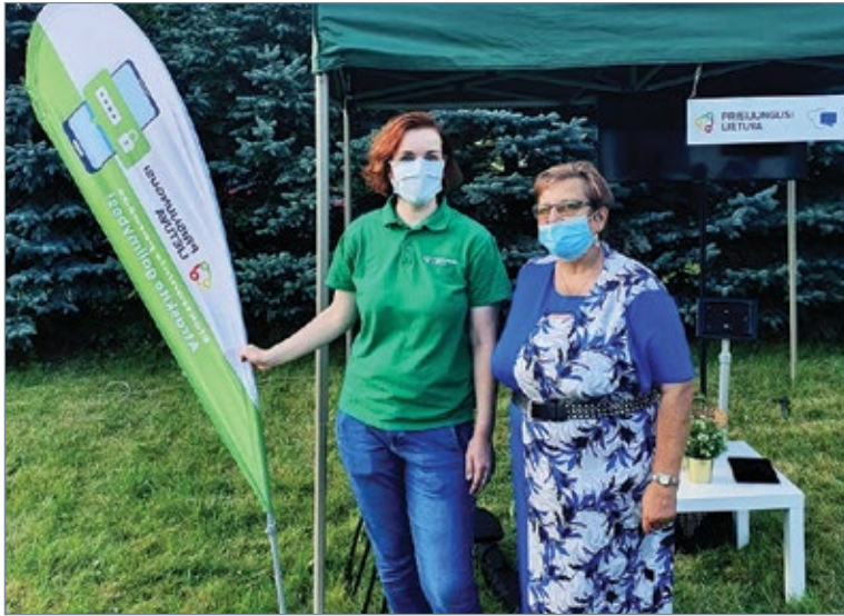
2020 m. rugpjūčio 22 d. Družų kaime vykusį kraštiečių šventę.

Į internetinę svetainę www.druzai.lt perkeltos bendruomenės veiklos, sukurtos naujos ir patobulintos jau esamos paslaugos bendruomenės nariams. Tai sustiprino bendruomenės veiklos žinomumą ir paskatino gyventojus dažniau naudotis internetu. Archyvuose buvusi medžiaga dabar yra skaitmenizuota ir perkelta į nuotraukų ir vaizdo galerijos skiltis. Dalis bendruomenės narių buvo apmokyti, kaip skelbti informaciją internetinėje svetainėje, naudotis turinio administravimu ir maketuoti nuotraukas. Daug dėmesio skirta svetainės dizaino tobulinimui, kad lankytojas vis dažniau apsilankytų svetainėje ir nuolat stebėtų organizacijos skelbiamas naujienas. Kuriant naują skaitmeninę erdvę gimė mintis ją praturtinti ir naujomis veiklomis. Nuspręsta dalintis in-